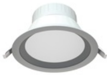
COLIBRI DL LED