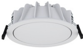
COLIBRI DL LED